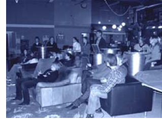
...och i Järfälla